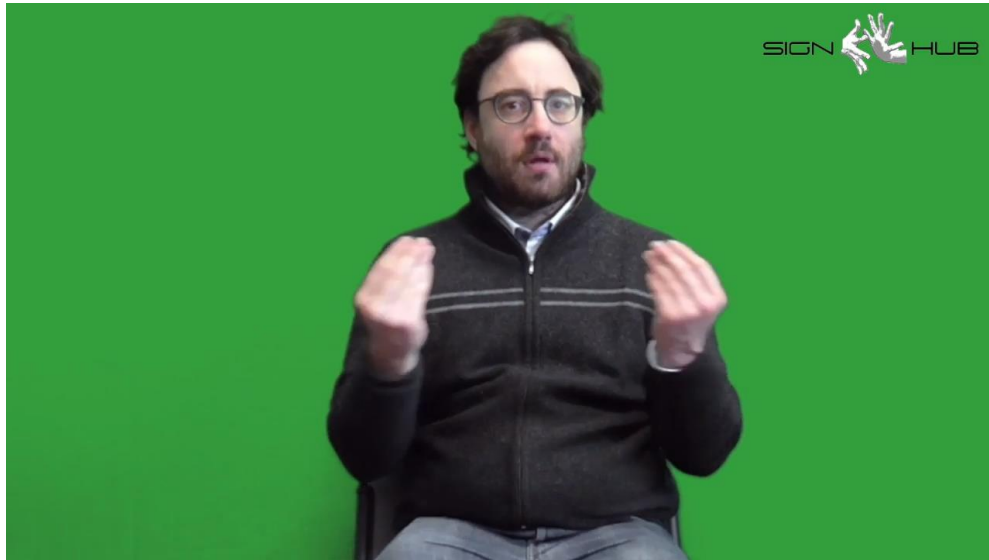
CHIAVE TANTO 'Tante chiavi'