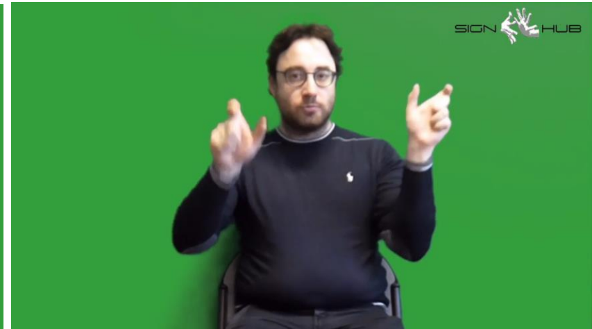
dom: PERSONA++ n-dom: PERSONA++ 'Persone'