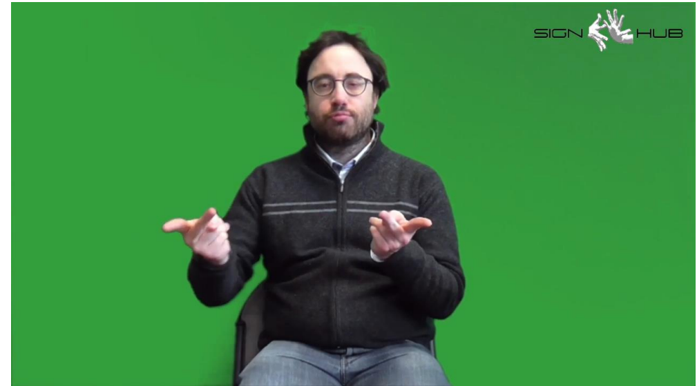
FORBICI CL(V): 'forbici_localizzate'++ 'Tante forbici'