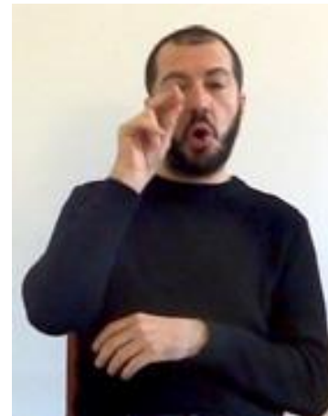
corpo-sin: a CONOSCERE