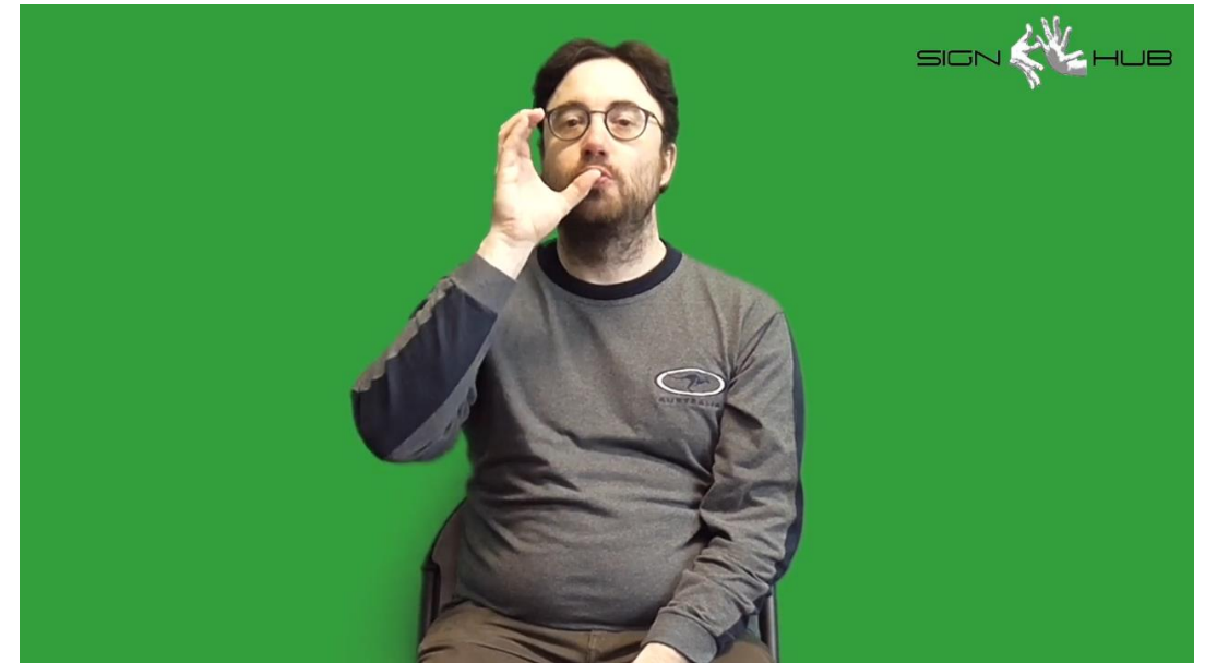
CL(5 unita curva aperta): 'bere_dal_bicchiere' 'Bere dal bicchiere'