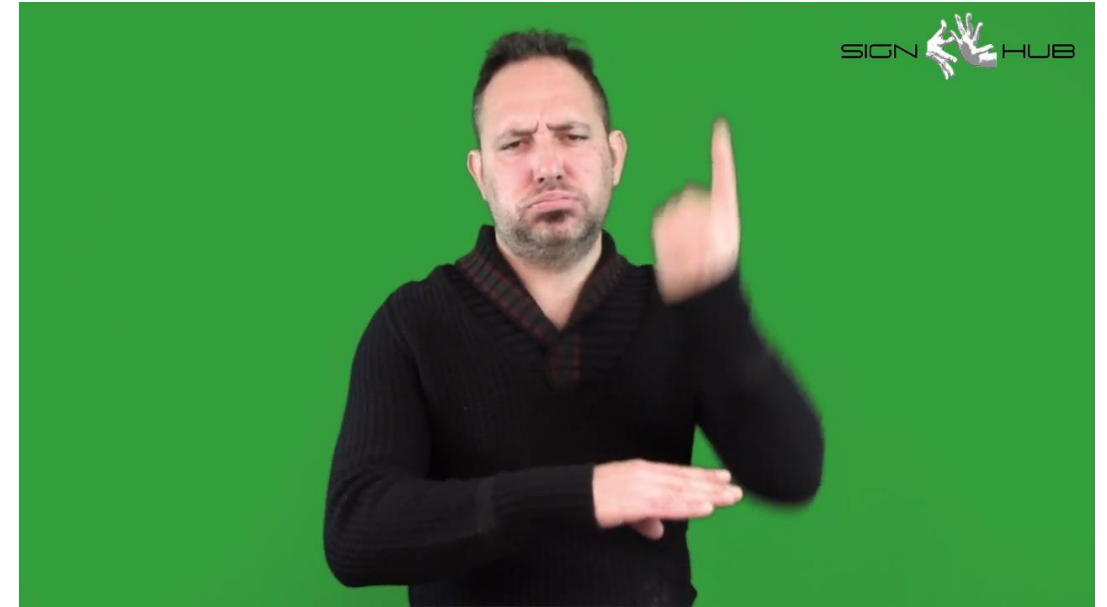
gg b-protrusa CL(G): 'missile_decolla' 'Il missile sta decollando.'