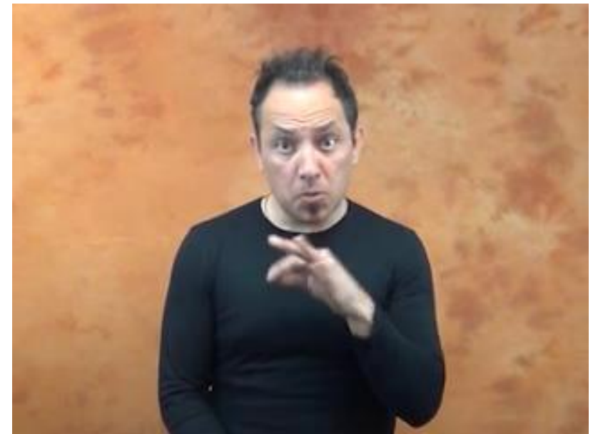
SI/NO BAGNO IX1 ANDARE POTERE 'Posso andare in bagno?'